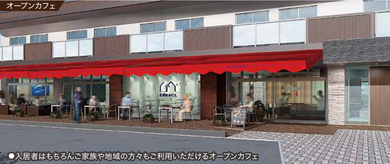
●入居者はもちろんご家族や地域の方々もご利用いただけるオープンカフェ