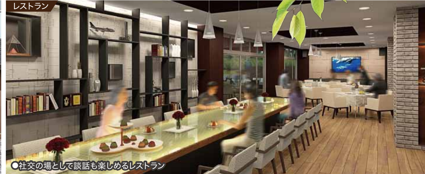
●社交の場として談話も楽しめるレストラン