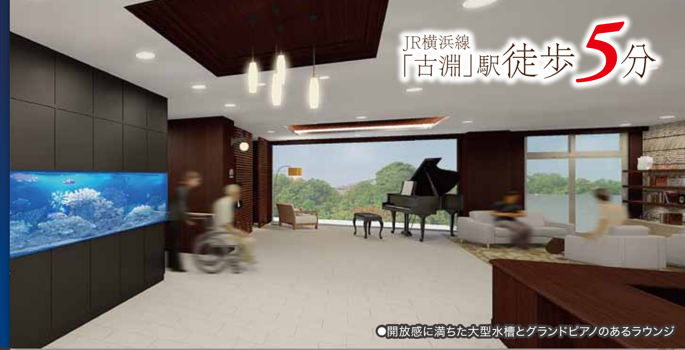
●開放感に満ちた大型水槽とグランドピアノのあるラウンジ