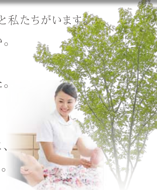
※掲載イラストは図面を基に描いたもので実際とは異なります。掲載写真はイメージです。

笑顔あふれる暮らしの中に、ご入居者様と私たちがいます。 私たちは、「家族」のような存在でありたい。 そのような思いを込めて、 「クラーチ・ファミリア古淵」と名付けました。 JR古淵駅より徒歩5分の好立地に 「クラーチ・ファミリア古淵」が誕生します。 自然に囲まれ眺望が優れた住まいの中に、 常に笑い声が溢れるホームづくりをします。