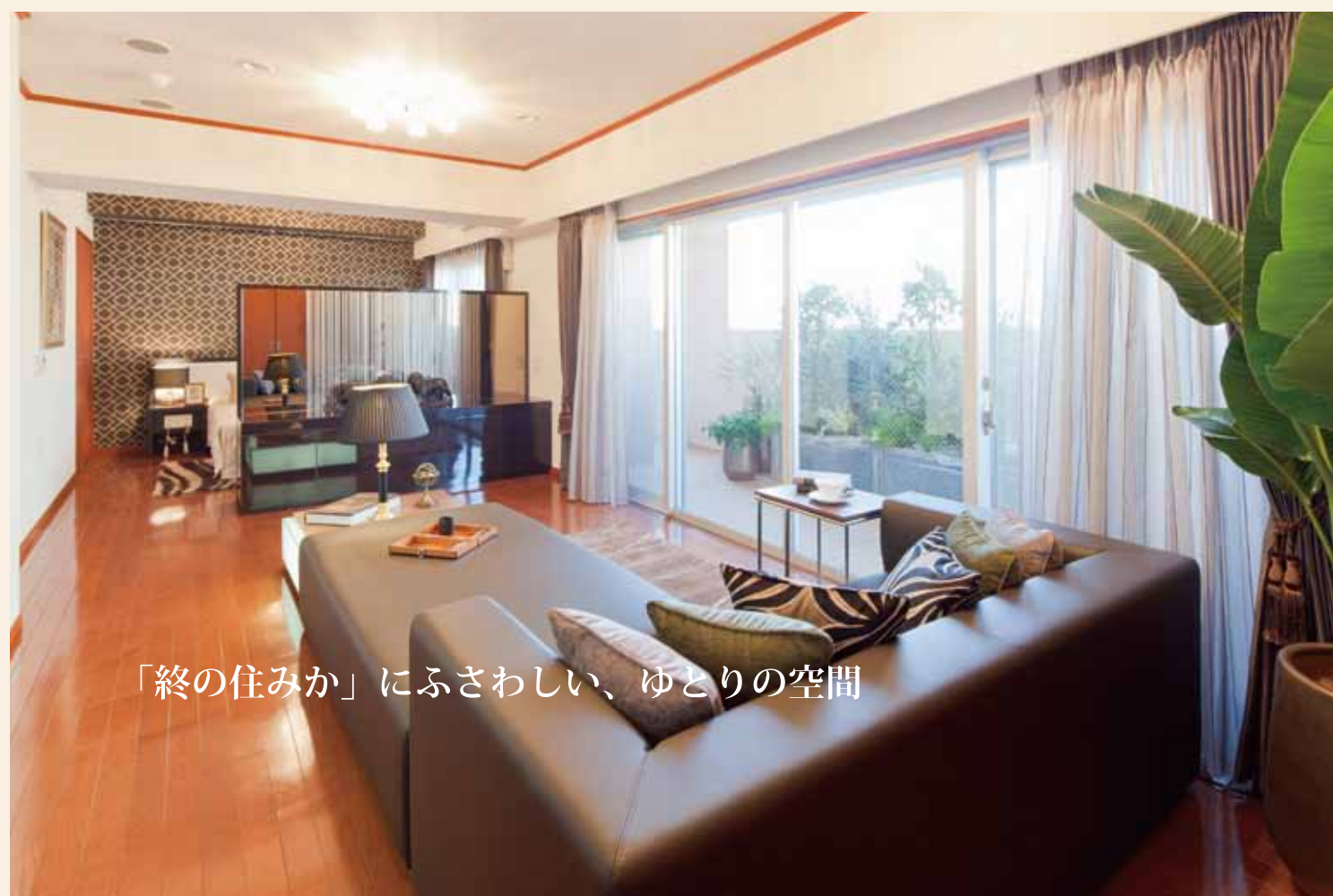
「終の住みか」にふさわしい、ゆとりの空間

多くの文豪に愛された歴史と文化の薫る街「文京区本郷」 東京メトロ南北線「東大前」駅上の交通至便の立地ながらも、 豊かな緑に囲まれた優雅な住まい。