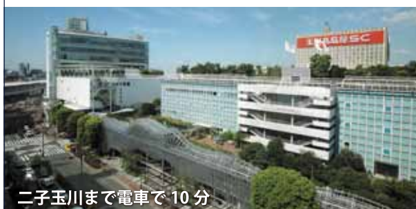
二子玉川まで車で10分