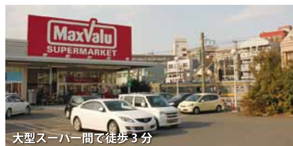
大型スーパー間で徒歩3分