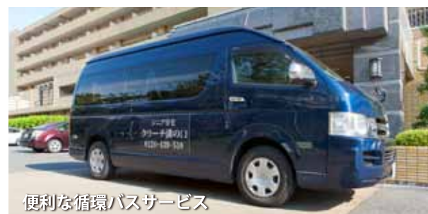
便利な循環バスサービス